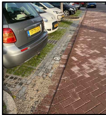
Voorbeeld: parkeerplaats met kunststof grastegels