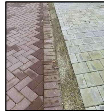
Voorbeeld: overrijdbaar trottoir