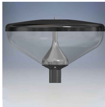
Voorbeeld: armatuur lichtmast