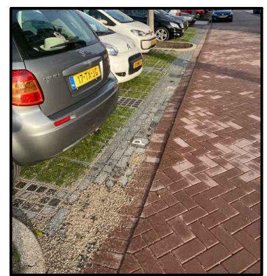
Voorbeeld: parkeerplaats met kunststof grastegels