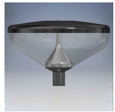
Voorbeeld: armatuur lichtmast