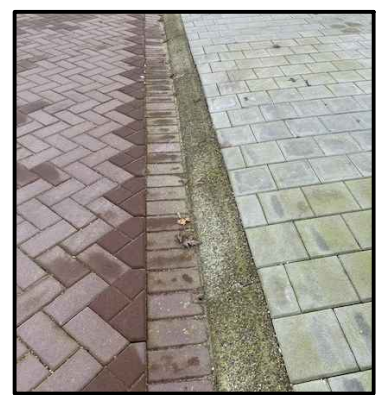
Voorbeeld: overrijdbaar trottoir