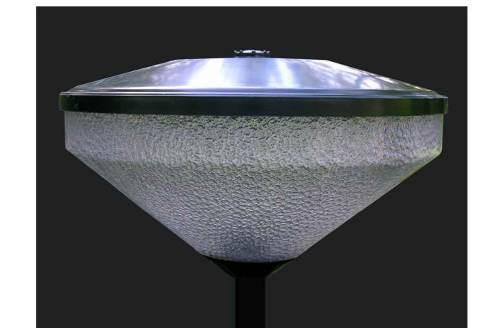
Impressie lichtmast met kegel armatuur